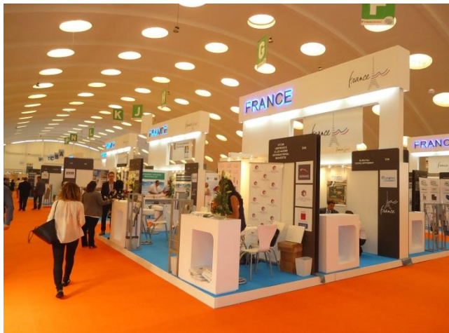
Pavillon France salon POLLUTEC Maroc 2014 (photo non contractuelle)